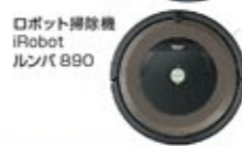
ロボット掃除機 iRobot ルンパ 890