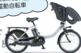
ヤマハ PAS Kiss mini un PA20KXL+ 専用充電器