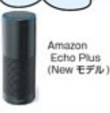
Amazon Echo Plus (New Model)