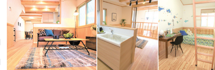
原町モデルルーム、令和2年7月撮影

施工例 自由設計が可能なアイワホーム。ライフスタイルに合わせた住宅をご提案いたします。あなたの「夢」をお聞かせください。