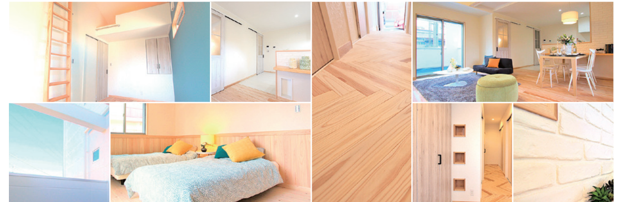
泉町モデルルーム、令和2年8月撮影

施工例 自由設計が可能なアイワホーム。ライフスタイルに合わせた住宅をご提案いたします。あなたの「夢」をお聞かせください。