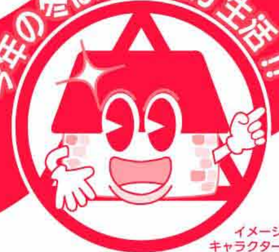
イメージキャラクター まるで新築くん